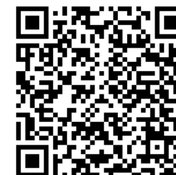
QR code Google form กรอกข้อมูล